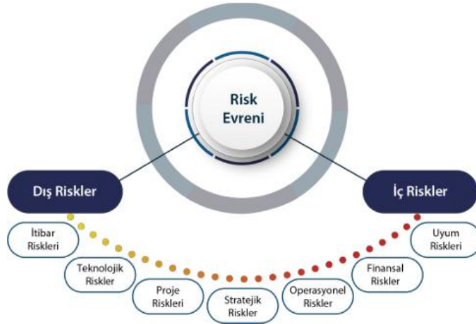
Şekil 2. Risk Evreni

Kurumsal Risk Yönetimi; üniversitemizin amaç ve hedeflerine ulaşmasına ve performansını geliştirmesine katkı sağlayacaktır.