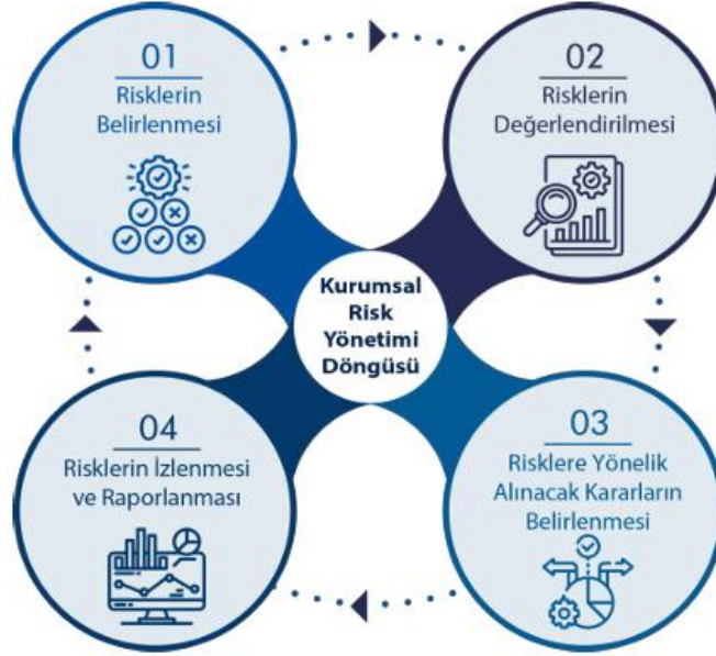
Şekil 1. Kurumsal Risk Yönetimi

Kurumsal Risk Yönetimi; üniversitemizin amaç ve hedeflerine ulaşmasına ve performansını geliştirmesine katkı sağlayacaktır.