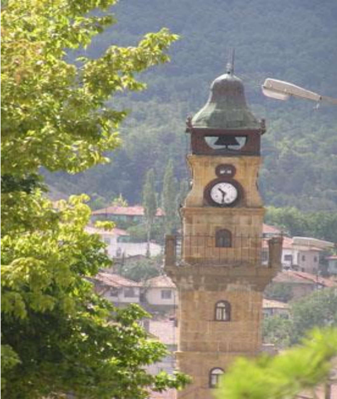
Ülkemizin ilk ulusal parkı "Yozgat Çamlığı Milli Parkı" - 1958