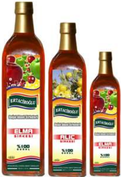
750 ML 500 ML 250 ML