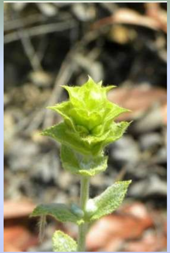
Sideritis congesta (Başakçayı)