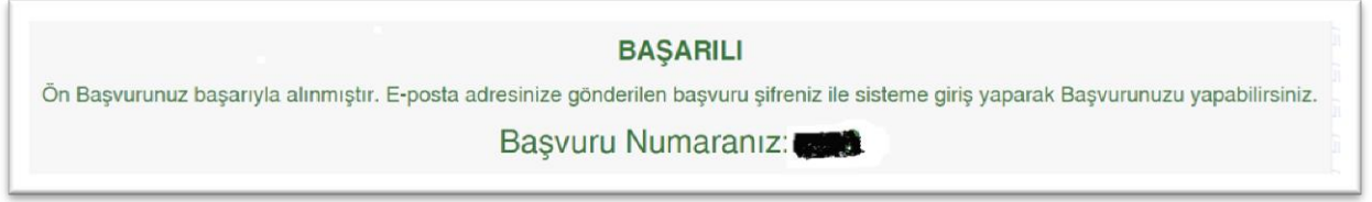
Tablo 5 (E-posta adresinize başvuru şifreniz gönderilmiştir. Başvuru linkine tıklayarak başvurunuzu yapınız.)