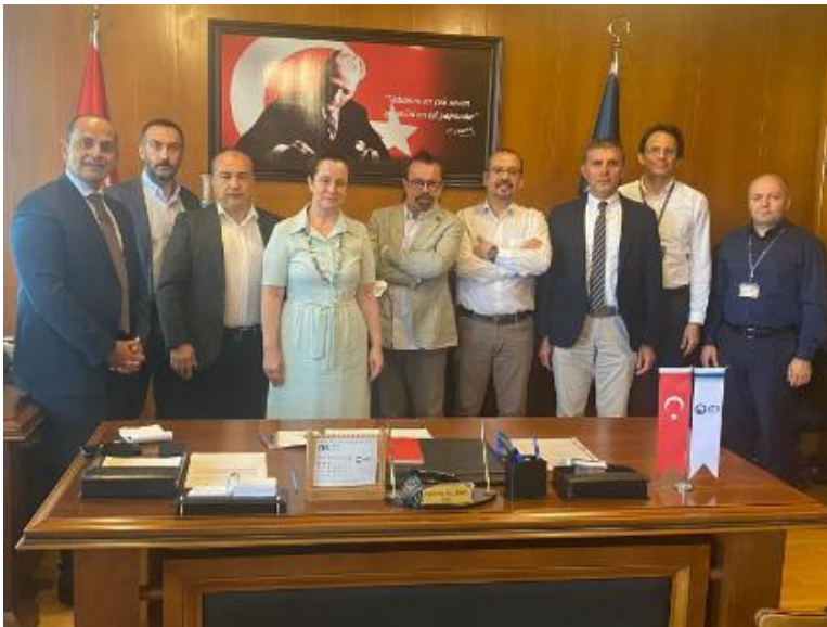
Resim 3. Plastik Rekonstrüktif ve Estetik Cerrahi Anabilim Dalı