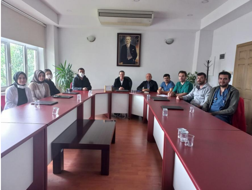
Resim 2. Dekan ile tanışma ve bilgilendirme toplantısı