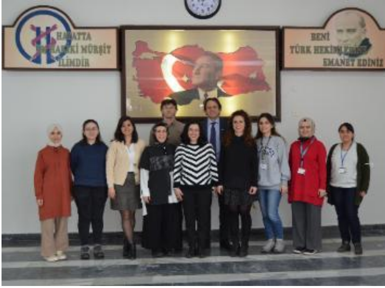
Resim 2. Tıbbi Patoloji Anabilim Dalı

KTÜ Tıp Fakültesi bünyesinde yer alan her bir anabilim dalı ile "akreditasyon faaliyetleri" konusunda toplantı yapılarak uzmanlık eğitiminin akreditasyonu teşvik edildi. 2022 yılı içerisinde Tıbbi Patoloji Anabilim Dalı, Plastik Rekonstrüktif ve Estetik Cerrahi Anabilim Dalı, Radyoloji Anabilim Dalı ve Kadın Hastalıkları ve Doğum Anabilim Dalı olmak üzere toplam dört anabilim dalı uzmanlık eğitiminde akredite oldu (Resim 2, Resim 3 ve Resim 4).