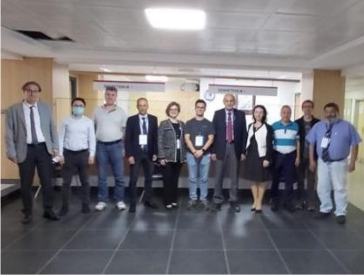
Resim 4. Radyoloji Anabilim Dalı

Tıpta ve Diş Hekimliğinde Uzmanlık Eğitimi Yönetmeliğinin değişmesi (Resmî Gazete Tarihi: 03.09.2022 Resmî Gazete Sayısı: 31942) üzerine "Uzmanlık Eğitimi İş Akış Şeması", "Uzmanlık Tezi ve Değerlendirmesi İş Akış Şeması" ve "Uzmanlık Eğitimini Bitirme Sınavı ve Eğitimin Tamamlanması İş Akış Şeması" yönetmeliği göre gözden geçirilerek gerekli düzenlemeler yapıldı. İş akış şemalarına https://www.ktu.edu.tr/medmse adresinden ulaşılmaktadır.