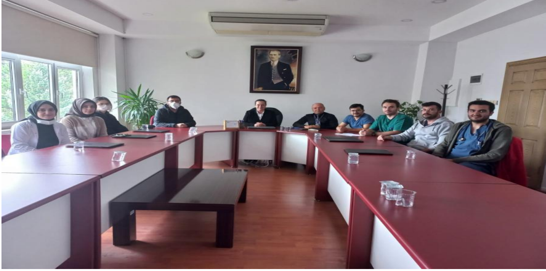
Resim 2. Dekan ile tanışma ve bilgilendirme toplantısı

Gelişim programları da üç farklı modül halinde birinci, ikinci ve üçüncü yıl asistanları için web tabanlı olarak yapılmakta ve eğitimle ilgili katılım belgeleri araştırma görevlileri tarafından yıllık değerlendirme dosyalarının eki olarak sunulmaktadır.