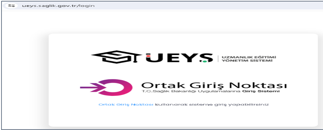
Resim 4. Uzmanlık Eğitimi Yönetim Sistemi (UEYS)

Uzmanlık Eğitimi Takip Sistemi (UETS), Sağlık Bakanlığı tarafından Uzmanlık Eğitimi Yönetim Sistemi (UEYS) şeklinde değiştirilerek güncellendi (Resim 4). Yeni sisteme uzmanlık eğitimi veri girişleri devam etmektedir. Bakanlıkça 2024 yılının ilk çeyreğinde tümüyle bu sisteme geçilmesi planlanmıştır.