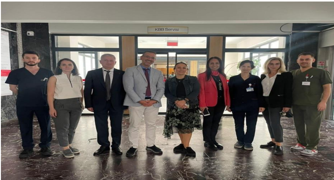
Resim 3. Kulak Burun Boğaz Anabilim Dalı

KTÜ Tıp Fakültesi bünyesinde yer alan her bir anabilim dalı ile "akreditasyon faaliyetleri" konusunda toplantı yapılarak uzmanlık eğitiminin akreditasyonu teşvik edildi. 2023 yılı içerisinde Kulak Burun Boğaz Anabilim Dalı uzmanlık eğitiminde akredite oldu (Resim 3).