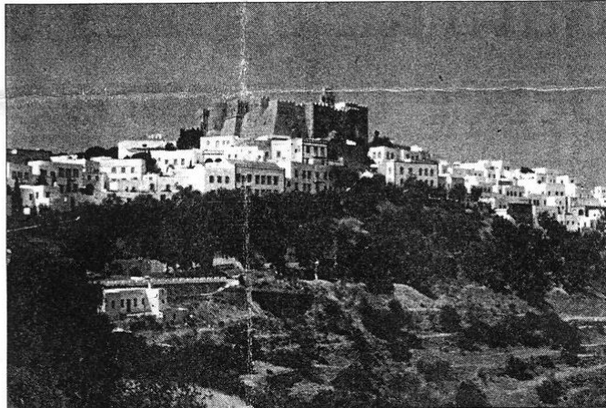
Apocalypse now: Patmos, the island of the Revelation, is the focus of environment symposium

The symposium will take place on board a cruise ship which will set sail for Istanbul from Piraeus on September 20. In between sessions, participants will visit Kusadasi, Ephesus and the tomb