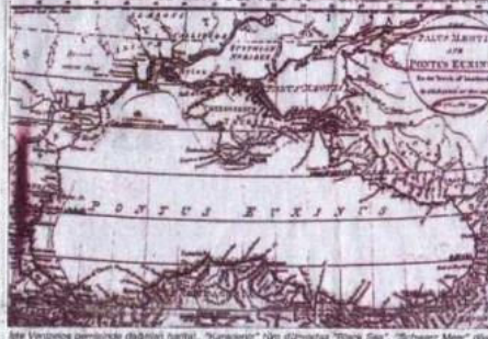
İki Venizelos gemisinde dağıtılan haritalar. "Karadeniz" tüm Ortadoğu "Black Sea", "Schwarz Meer" diye de denir. Şimdi de Karadeniz'in adı Rumca Pontus Gölü olarak değiştirildi.

● Yetkililer, "Trabzon Limanı"ndan 20 Eylül'de başlatılan ve genelolgu dışındaki katılan ürsürat ile gündeme gelen sempozyum için bütün yasal önlemlerin alındığını, inşaat ve filli sâidin olduğunu, katılımcıların Sürmelâ Manastırını geçtiklerini" belirtmiş. Bütün bu belgeler, Ortadoğu'nun haberleri ile yazıları ile bir peşpeşe parmak başkanı ve "Papazlar"ın oylu su üzüne çıkardığını ortaya koyuyor.