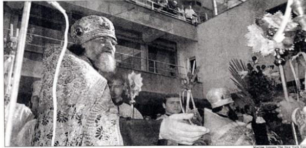
Ecumenical Patriarch Bartholomew I of Constantinople on the Black Sea last month for a conference on saving the environment.

But environmentalism is a unifying theme in a church full of rivalries. On this journey,