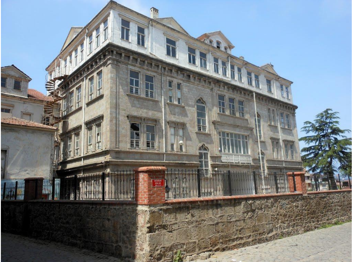
Trabzon İktisadi ve Ticari İlimler Akademisi'nin (TİTİA) Üç Yıl Boyunca Öğretim İçin Kullandığı Nemlioğlu Konağı

Ulusal ve uluslararası düzeyde önde olup eğitim, öğretim ve araştırma kalitesiyle katma değer yaratan işletme bölümlerinden biri olmaktır.