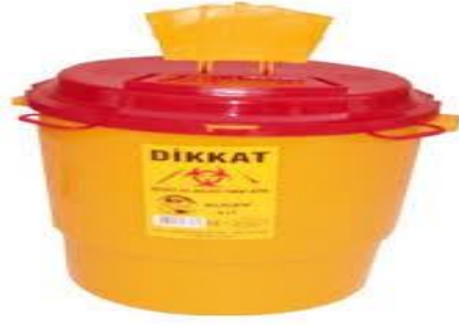
Resim 1. 6: Kesici-Delici Atık Kutusu