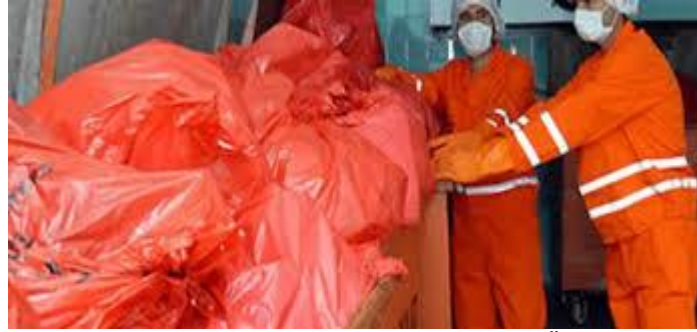
Resim 2.6 Tıbbi Atıkların Diğer Atıklardan Ayır Ve Özel Depolanması

Atıklar, bertaraf sahasına taşınmadan önce 48 saatten fazla olmamak üzere bu depolarda veya konteynerlerde bekletilebilir. Bekleme süresi, geçici atık deposu içindeki sıcaklığın 4 C 'nin altında olması koşuluyla bir haftaya kadar uzatılabilir.