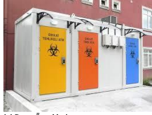
Resim 2.7: Tıbbi Atık Geçici Depo Örnekleri

Geçici tıbbi atık deposunun temizliği çok önemlidir. Tıbbi atıkların konulduğu bölgenin temizliği ve dezenfeksiyonu kuru olarak yapılmalıdır. Bölme, atıkların boşaltılmasının ardından hemen sonra temizlemeli, dezenfekte edilmeli ve gerekirse ilaçlanmalıdır. Tıbbi atık içeren bir torbanın yırtılması veya boşalması sonucu dökülen atıklar, uygun ekipman ile toplandıktan ve sıvı atıklar ise uygun emici malzeme ile yoğunlaştırıldıktan sonra tekrar kırmızı renkli plastik torbalara konulmalı ve kullanılan ekipman ile birlikte bölme, derhal dezenfekte edilmelidir.