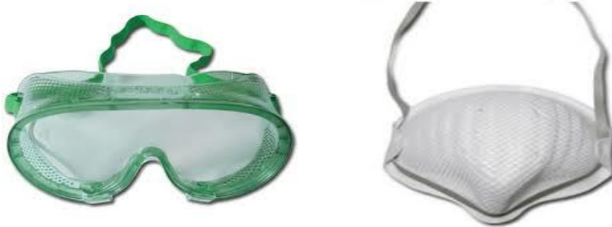
Resim 2. 2: Tıbbi Atık Personelinin Kullandığı Maske Ve Gözlük