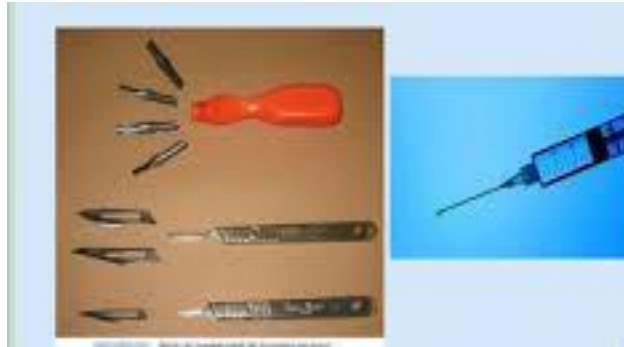
Resim 1.4: Delici Kesici Atıkların Yaralanmalara Neden Olabilmesi