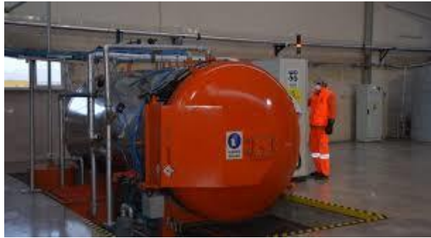
Resim 2.16: Sterilizasyon Tesisi Çalışmalarından Bir Görüntü

Ayrıca sterilizasyon tesislerinde bir geçici atık deposunun bulunması, sistemin atık parçalama mekanizmasına sahip olması, işlem sırasında ve sonrasında hava ve su ortamında hiçbir kontaminasyon ve toksisitenin olmaması gerekir. Miktar, basınç, sıcaklık ve atığın işleme maruz kalma süresi olmak üzere bütün işlemlerin elektronik olarak kayıt altına alınması ve sterilizasyon işlemine tabi tutulan enfeksiyöz atıkların zararsız hale getirilip getirilmediğinin kimyasal ve biyolojik indikatörler kullanılarak test edilmesi gerekmektedir.