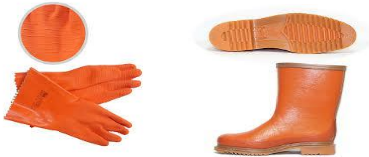
Resim 2. 3: Tıbbi Atık Personelinin Kullandığı Eldiven Ve Çizme