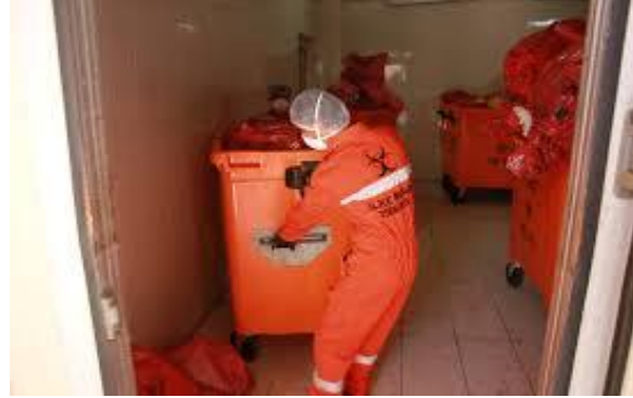
Resim 2.10: Tıbbi atıkların yetkili personel tarafından toplanmasının gerekliliği

Tıbbi atıkların ünitelerden alınma sırasında atıkların ünite tarafından taşıyıcıya verildiğinin, taşıyıcı tarafından teslim alındığının ve taşıyıcı tarafından da tesisine verildiğinin belgelenmesi amacıyla ünite ile taşıyıcı /bertaraf eden kurum /kuruluş arasında tıbbi atık alındı belgesi /makbuzu düzenlenmelidir.