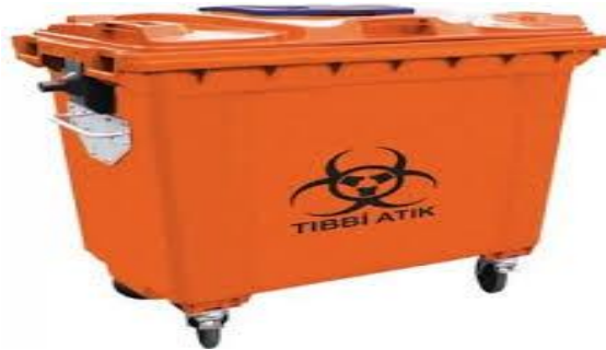
Resim 2.8: Tıbbi Atık Depolama Konteyneri Örnekleri

Küçük miktarlarda üretilen tıbbi atıkların geçici depolanması ile ilgili Yönetmelik'te belirtilen, küçük miktarda tıbbi atık üretilen ünitelerde oluşan ve tıbbi atık torbaları ile kesici-delici atık kapları ile