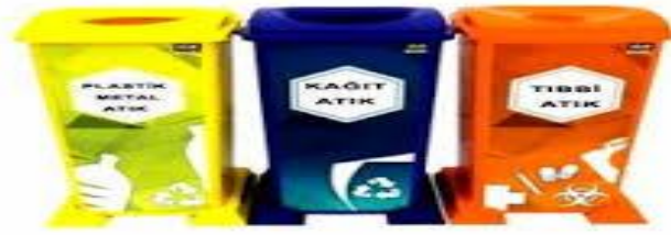
Resim 1.8: Sağlık Kuruluşları İçin Geri Dönüşümlü Atık Toplama Poşeti