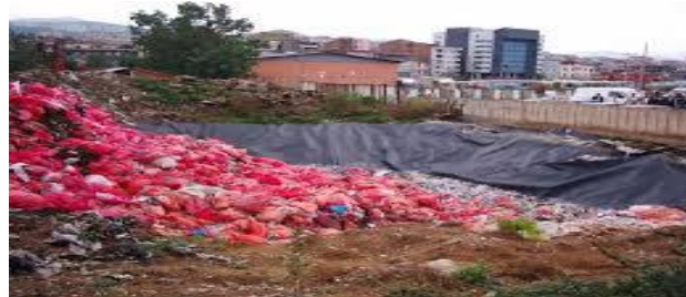
Resim 2.15: Tıbbi Atıkların Düzenli Depolanması