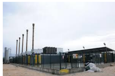
Resim 2.13 Tıbbi Atık Yakma Tesisi