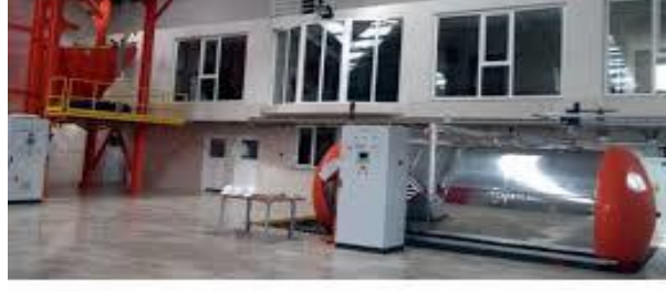
Resim 2.18: Tıbbi Atık Sterilizasyon Ünitesi