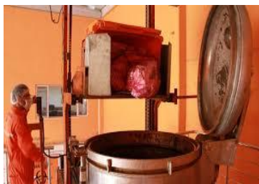
Resim 2.12: Tıbbi Atıkların Yakılma İşlemi

Yakma, tıbbi atıkların bertarafında en güvenli yöntem olmakta birlikte yatırım ve işlem maliyetlerinin yüksekliği ve ileri teknoloji gerektirmesi nedeniyle kurulması ve işletilmesi oldukça zor bir bertaraf yöntemidir.