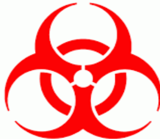
Resim 1. 1 Uluslararası Tıbbi Atık Amblemi

Bu amblem “ Uluslararası Biyotehlike Amblemi ” olup bu amblemin kapsamında toplanmasında taşınmasında, geçici depolanmasından bertarafına kadar diğer atıklardan ayrı işlem görmesi gereken tehlikeli hastane atıkları yer almaktadır.