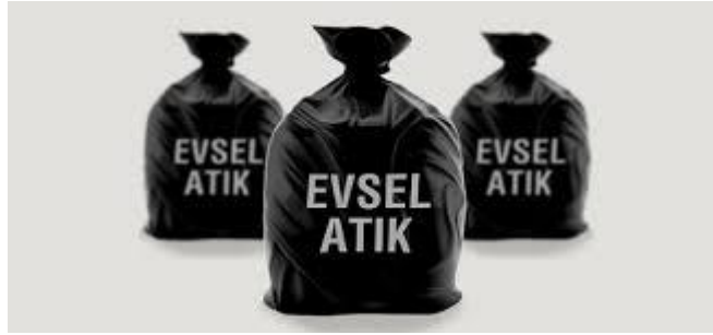
Resim 1.9: Sağlık Kuruluşları İçin Evsel Atık Poşeti

Evsel nitelikli atıklar; tıbbi, tehlikeli ve ambalaj atıklarından ayrı olarak siyah renkli plastik torbalarda toplanmalıdır. Aynı toplanan evsel nitelikli atıklar, ünite içinde sadece bu iş için ayrılmış taşıma araçları ile taşınan geçici atık deposuna veya konteynere götürülür ve ayrı olarak geçici depolanır. Evsel nitelikli atıklar toplanmaları sırasında tıbbi atıklar ile karıştırılmamalıdır. Karıştırılmaları durumunda tıbbi atık olarak kabul edilmelidir.