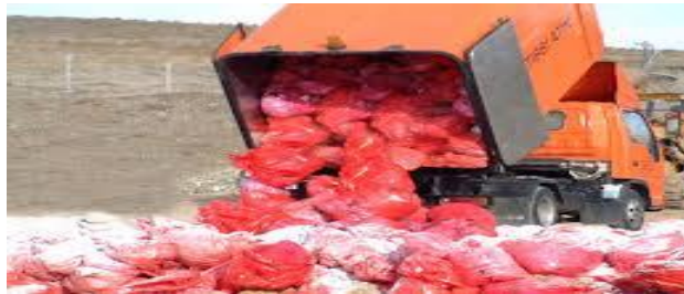
Resim 2.14: Tıbbi Atıkların Araçlardan Düzenli Depolama Alanına Boşaltılması

Geçimsiz zemin üzerinde tıbbi atıklar sıkıştırılmadan doldurulmalı dolgu işlemleri sırasında günlük olarak atıkların üstü önce kireç, sonrada en az 30 cm toprak ile örtülmelidir. Depo tesisi dolduktan sonra deponun üstü yine mineral sızdırmazlık tabakası (kil) ve lastik geçirimsizlik tabakası kullanılarak depo gövdesine yüzeysel su girmeyecek şekilde sızdırmaz hale getirilmelidir. Depo üst yüzeyine nihai eğitimi % 5’ ten küçük olmayacak şekilde eğim verilmeli ve kalınlığı en az 1 metre olan tarım toprağı serilerek yeşillendirilmelidir. Kurulacak tıbbi atık düzenli depolama tesisleri için Çevre ve Orman Bakanlığından ön lisans ve lisans alınması gerekmektedir.