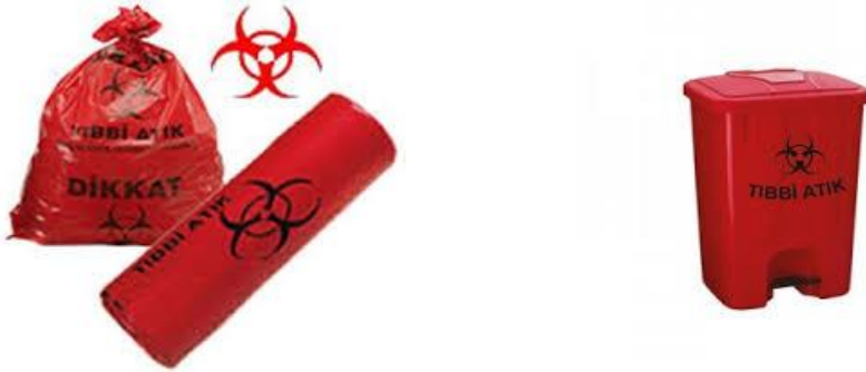
Resim 1.7: Sağlık kuruluşları için tıbbi atık poşeti ve kutusu