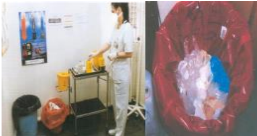
Resim 1.2: Kaynağında Ayrı Toplanması Gereken Enfekte Atıklar

Enfekte kişi ve hayvanlarla eden temas eden diğer malzeme veya aletler: