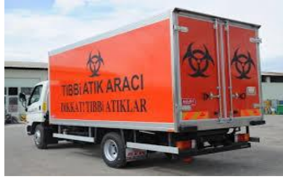
Resim 2.5: Tıbbi Atık Toplama Aracı