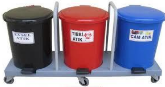
Resim 2.1: Sağlık Kuruluşları İçin Atıkları Kaynağında Ayırma Kutuları

Kesici ve delici özelliği olan atıklar, diğer tıbbi atıklardan ayrı olarak delinmeye yırtılmaya, kırılmaya ve patlamaya dayanıklı su geçirmez ve sızdırmaz açılması ve karıştırılması mümkün olmayan üzerinde “Uluslararası Biyotehlike” amblemi ile “DİKKAT KESİCİ ve DELİCİ TIBBİ ATIK” ibaresi taşıyan plastik veya aynı özelliklere sahip lamine kartondan yapılmış kutu veya konteynerler içinde toplanmalıdır. Kesici-delici atık kapları dolduktan sonra kesinlikle sıkıştırılmaz, açılmaz, boşaltılmaz ve geri kazanılmaz. Biriktirme kapları en fazla ¾ oranında doldurulmalı, ağızları kapatılmalı ve kırmızı plastik torbalara konularak yenileri ile değiştirilmelidir. Yeni torba ve kapların kullanıma hazır olarak atığın kaynağında veya en yakında bulundurulması sağlanmalıdır.