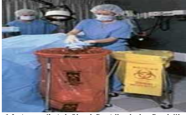
Resim 1.3: Anatomik Atık Olarak Da Adlandırılan Patolojik Atıklar