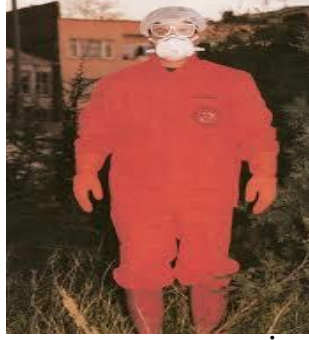
Resim 2. 4: Tıbbi Atık Personelinin Kullandığı İş Elbiseleri