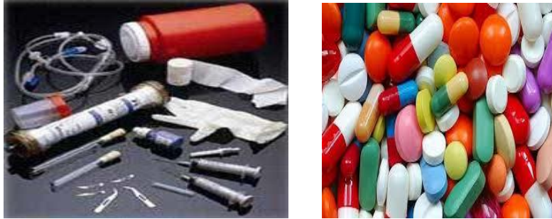
Resim 1.5 Farmasötik atık örnekleri