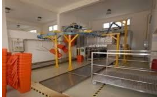
Resim 2.17: Sterilizasyon Tesisi İç Görüntüsü

Sterilizasyon tesislerinde geçici depolama yeri ve atık parçalama (shredding) mekanizmasının bulunması zorunludur, Sterilizasyon tesislerinin mekanik güvenlik ve sterilizasyon performansı açısından uluslararası standartlara (ISO, CE) uygunluğu belgelendirilmelidir. Sterilizasyon işlemine tabi tutulacak atıklar içinde patolojik atıklar içinde patolojik atıklar ile başta uçucu ve yarı uçucu organik maddeler ve cıva olmak üzere kimyasal maddeler, genotoksik/sitotoksik ajanlar, radyolojik atıklar ve basınçlı kaplar bulundurmamalı atık su ve hava arıtılarak / sterilize edilerek alıcı ortama verilmelidir.