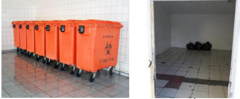
Resim 2.9: Tıbbi Atık Ve Evsel Atık Geçici Depolamanın İç Görüntüsü

Bu özellikte sağlık kuruluşları; ilgili mercilerden çalışma izni almadan önce atıklarının geçici depolanması konusunda en yakında bulunan geçici atık deposu veya konteynerin ait olduğu sağlık kuruluşu ya da atıklarının toplanması konusunda ilgili belediye ile anlaşma yapmak ve bu anlaşmaya valiliğe ibraz etmekle yükümlüdür.