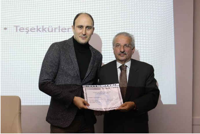
Bankacılık Sektörlerinde Rekabet-Mali Sağlıklı İlişkisi (Ekonomi ve Felsefe Toplantıları-149)